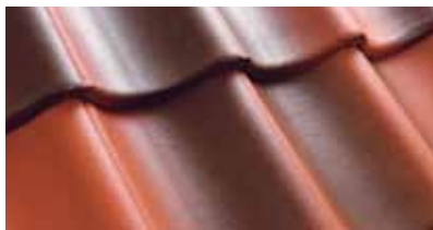
Baksteenrood/Bruin Geulamo 0100 29