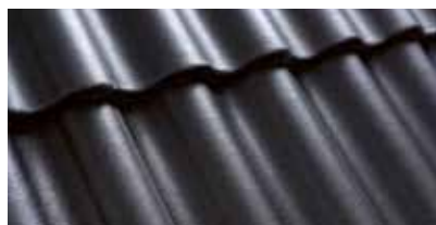
Leigrijs 0200 51