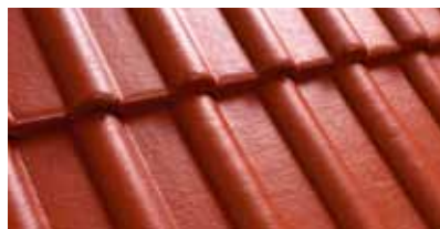
Terracottarood M200 86