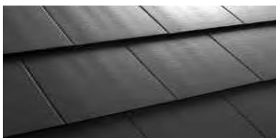
Schwarz C000 80