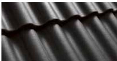
Antraciet 0200 21