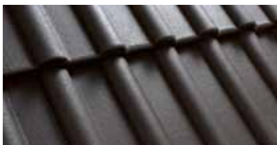
Antraciet M200 21