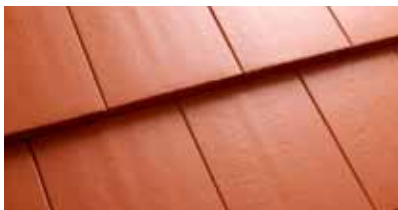
Baksteenrood C000 24