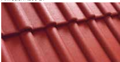
Rood M200 26