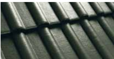
Olijfgroen M200 83