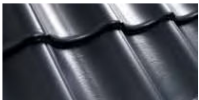
Brilliant Leigrijs 0100 51