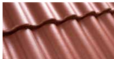
Koper 0200 55

* Koper: Geen voorraadproduct Levertijd op aanvraag. Geen gevelpannen.