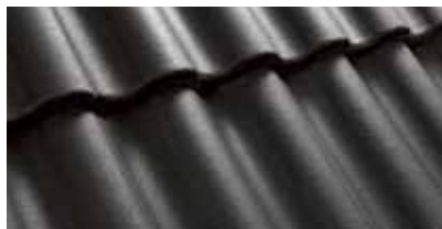
Zwart 0200 20