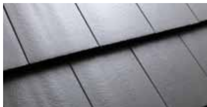
Antraciet C000 21