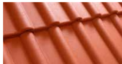
Baksteenrood M200 24