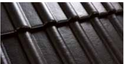
Zwart M200 80