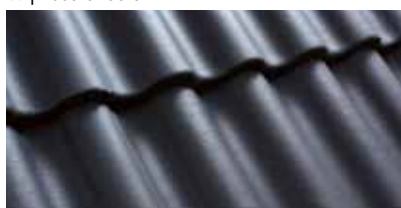
Blauw 0200 30