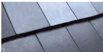
Schiefer C000 51

VLAKKE DAKPANNEN ALTIJD IN VERBAND LEGGEN