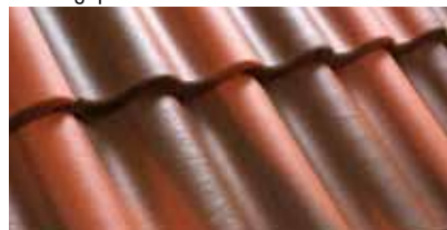
Baksteenrood/Bruin Geulamo 0200 29