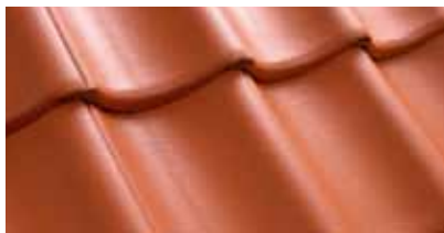
Baksteenrood 0100 24