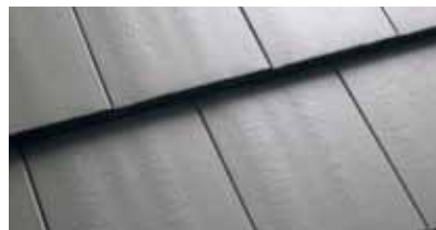
Middengrijs C000 28