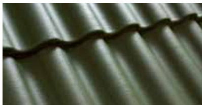
Groen 0200 23