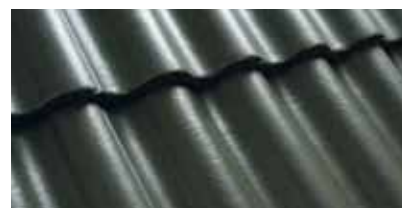
Olijfgroen 0200 83