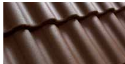
Bruin 0200 22