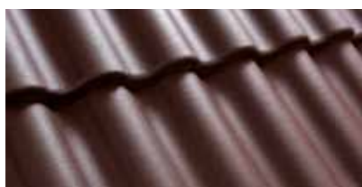
Wijnrood 0200 31