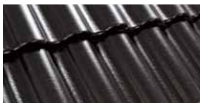
Zwart 0200 80