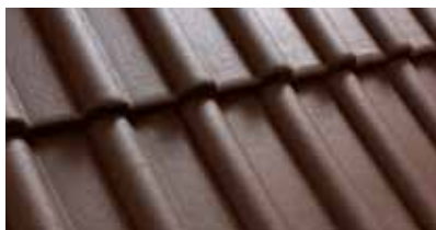
Bruin M200 22