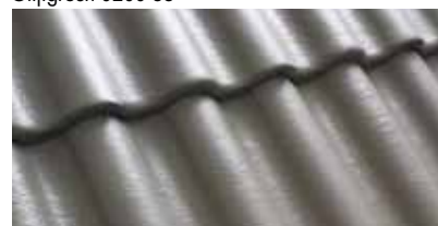
Middengrijs 0200 88